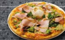
PÂTE À PIZZA MAISON