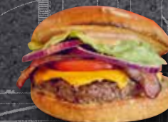
STEAK HÂCHÉ FRAIS & FRANÇAIS